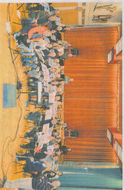
UT I VERDEN: Stangebygdenes Musikkl forening tar det med på en musikalsk rundreise i helga.