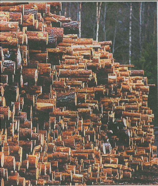
g næring i Innlandet, og må styrkes, mener