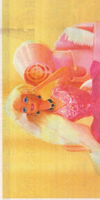
BARBIE: Det kjønnsdelte leketøymarkedet er tema for en konkurranse.

maet er idé til kunstvideo om «Toy's genderization». Kunstnere må være 18-35 år, norsk statsborger, beherske engelsk og levere individuelt arbeid. Målet med prosjektet er å analysere kvinnemuseenes rolle mot de ulike landenes likestillingspolitikk og lage en kampanje om «Det kjønnsdelte leketøymarkedet». Mer info på www.kvinnemuseet.no .