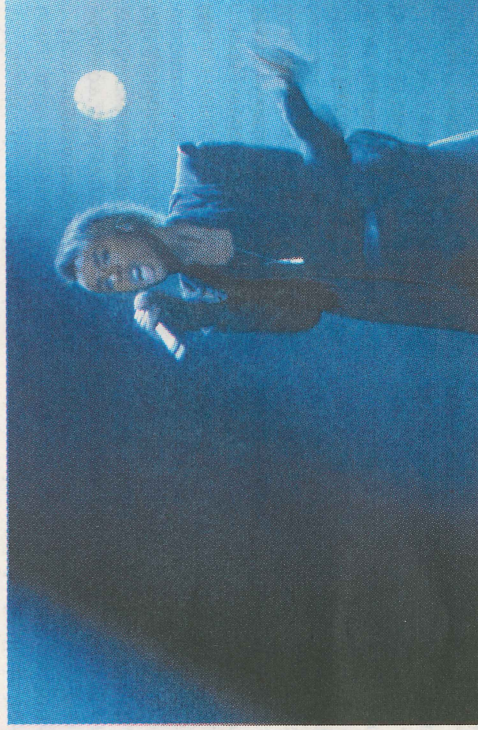
TREDJE FAVORITT: Å tippe at Mo fra Hamar vinner den norske MGP-finalen gir en odds på 8,00, ifølge Unibet.