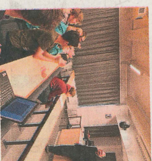
MÅL: Alle mot Jens, eller?

Bandet takker for seg med en spektakulær avskjedsturné. «Final Sting World Tour» som går over to år for fulle hus verden over.