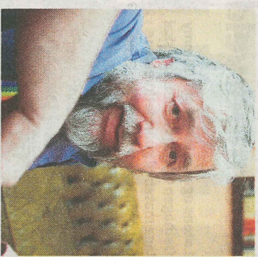
FORFATTER: Tor Åge Bringsværd.